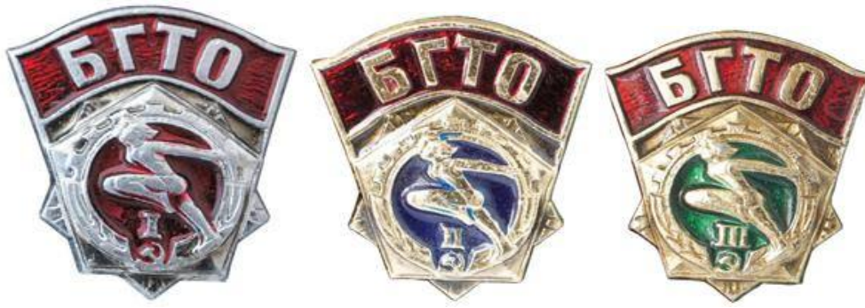
Значки БГТО I, II, III ступеней выпуска 1972 года