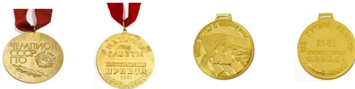
Значок и медали чемпионата СССР по многоборью комплекса ГТО на призы газеты «Комсомольская правда», Кишинёв, 1981 год