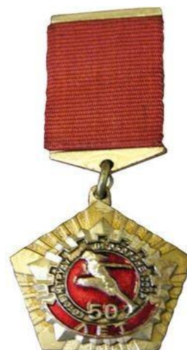
Знак «50 лет комплексу ГТО»