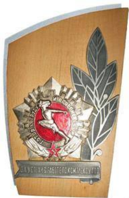
Знак «За успехи в работе по комплексу ГТО»