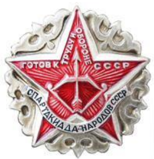
Значок региональных соревнований ГТО – Спартакиада народов СССР»