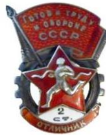
Значки «Отличник ГТО» 2 степени 1940-1946 годов (серебро и бронза)