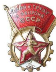
Значки ГТО I и 2 степеней 1946 – 1961 годов