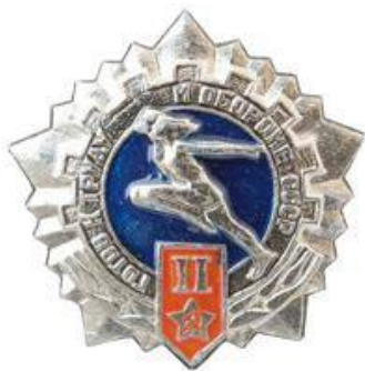
Значки ГТО в редакции 1985 года

В начале 1985 года в Комплекс ГТО был внесен очередной пакет с изменениями. Теперь комплекс для взрослых состоял из 3 ступеней, а для школьников—из 4-х.