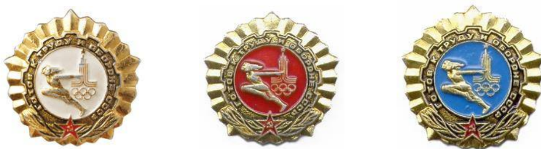
В 1980 году была выпущена специальная серия значков ГТО, посвящённая Играм XXII Олимпиады в Москве