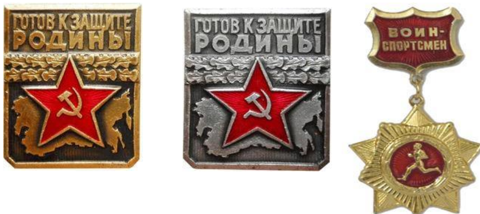
Золотой нагрудный знак «Воин-спортсмен», 1961 год

В 1966 году по инициативе ДОСААФ была разработана и введена в действие ступень комплекса ГТО для молодежи призывного возраста «Готов к защите Родины» (ГЗР).