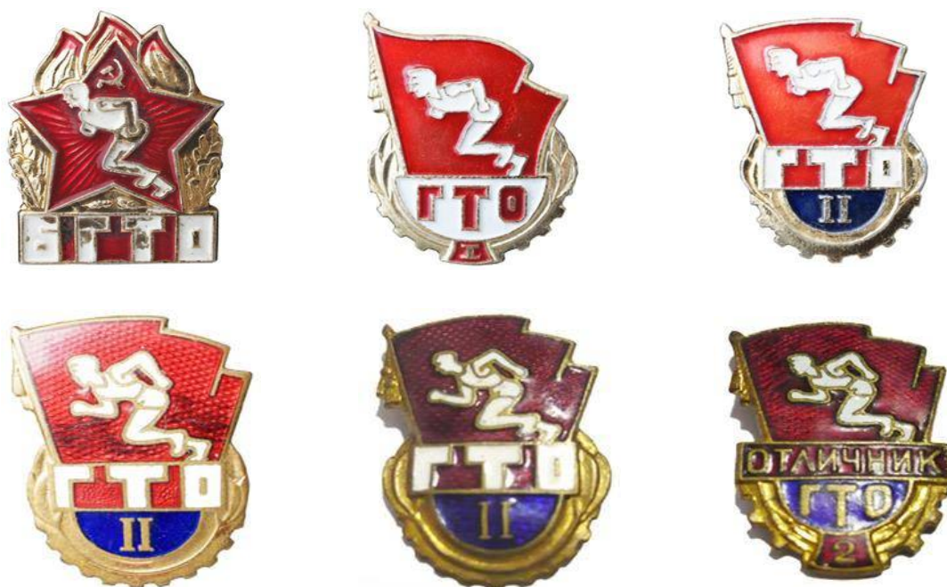
Значки БГТО и ГТО 1961 года

Обновленный Комплекс ГТО состоял из трех ступеней. Ступень БГТО - для школьников 14 - 15 лет, ГТО 1-й ступени - для юношей и девушек 16-18 лет, ГТО 2-й ступени - для молодежи 19 лет и старше.