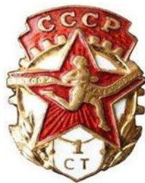
Значок «Отличник БГТО», 1940 год