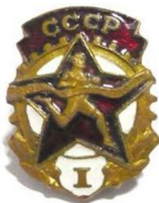
Значки «Будь готов к труду и обороне»