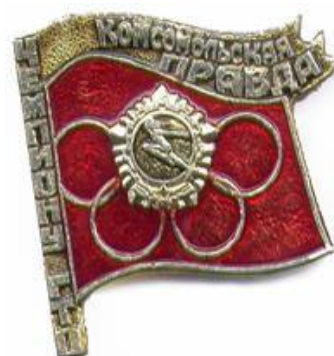
Значок «Чемпиону ГТО», Алма-Ата, 1979 год