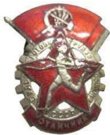
Значок ГТО 1 степени