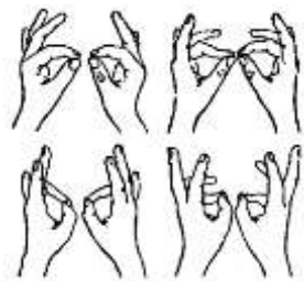
Рис.1 Развитие мелкой моторики рук («Колечко»)

Программа рассчитана на школьников, обучающихся в 1-4 классах. Возраст детей – 6,5-11,5 лет.