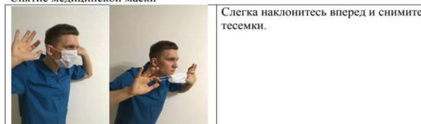
Снятие медицинской маски