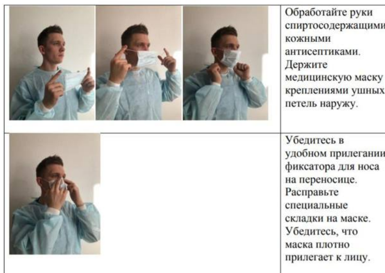
Надевание медицинской маски