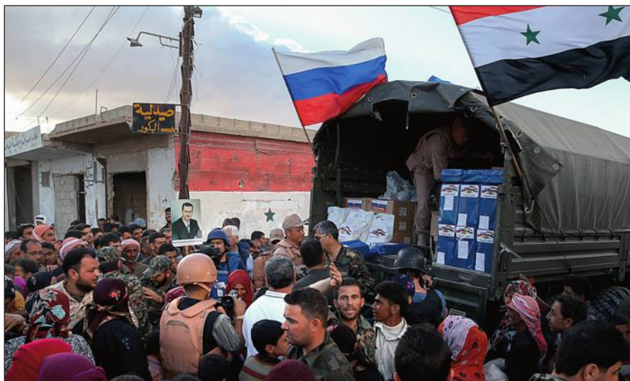
Россия оказывает гуманитарную помощь Сирии.