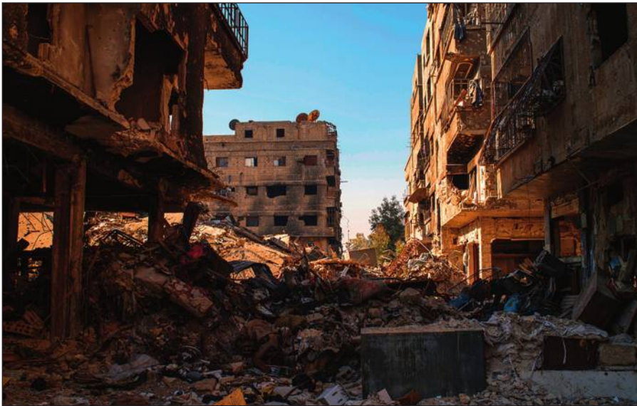
Разрушенный боевиками ИГИЛ Дамаск.

Террористы поставили на поток производство видеороликов с жестокими сценами казней пленников, заложников и «вероотступников». Эти материалы потом широко распространяются в социальных сетях и