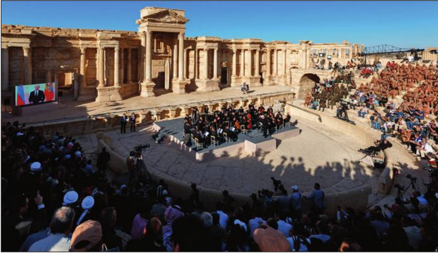
Освобожденная Пальмира. На концерте симфонического оркестра петербургского Мариинского театра под руководством народного артиста России Валерия Гергиева в Римском амфитеатре сирийской Пальмиры, освобожденной от террористов ИГИЛ.