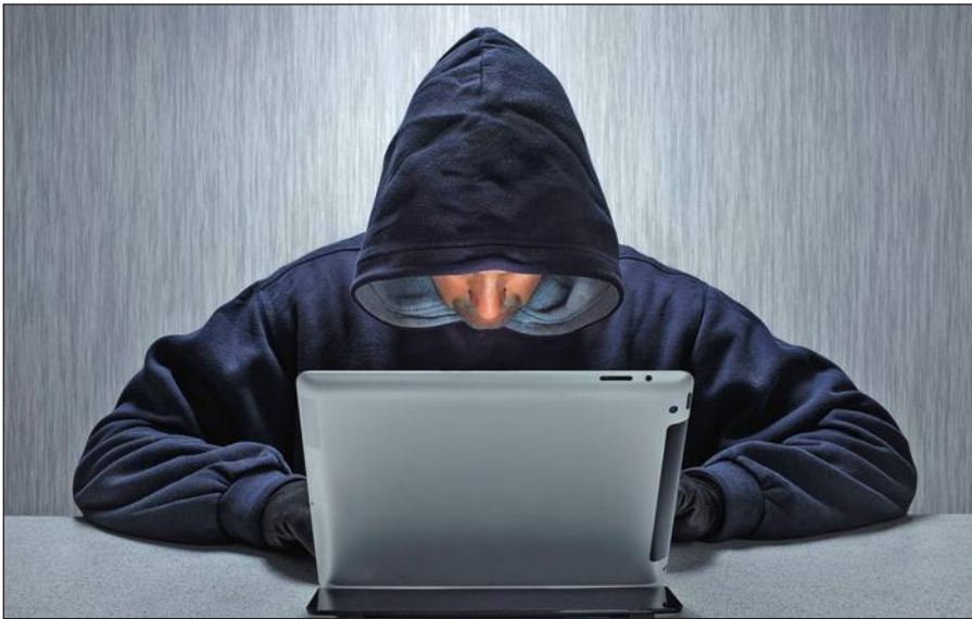
Вербовщики ИГИЛ активно используют Интернет.

Террористы день ото дня совершенствуют методы вербовки новых сторонников, а также алгоритмы их идеологической обработки. Читателю стоит помнить, что те типовые ситуации, которые описаны в данном пособии, можно рассматривать лишь в качестве базовых ориентиров,