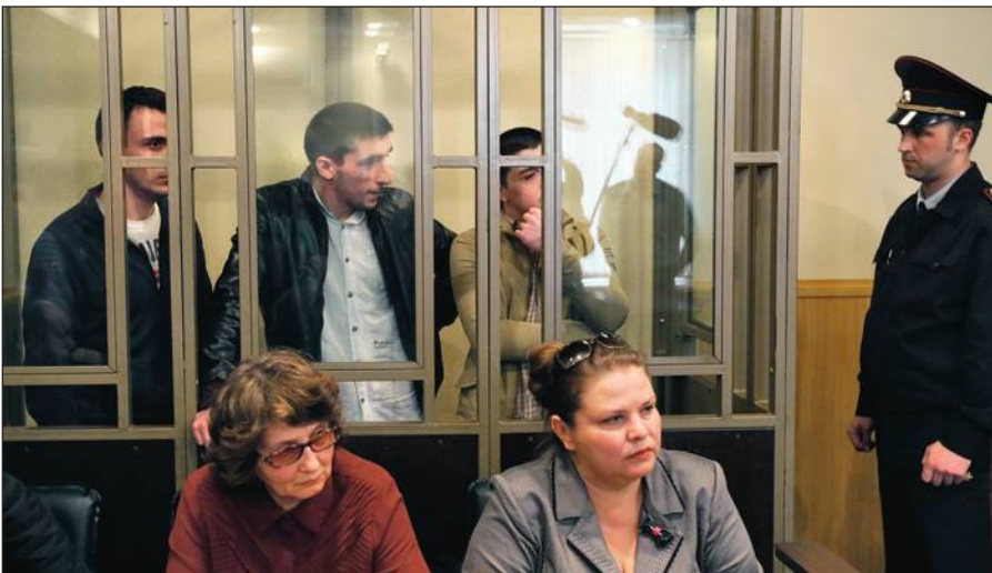
В Российской Федерации предусмотрена административная и уголовная ответственность за пропаганду идей терроризма, участие в деятельности террористических организаций.