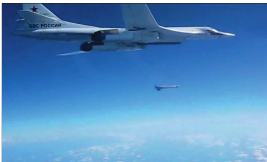
Воздушная операция российских ВКС по уничтожению боевиков ИГИЛ в Сирии.