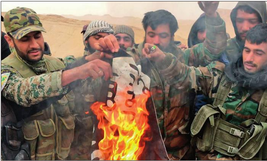
Народные ополченцы САР сжигают флаг ИГИЛ, снятый с отбитой у боевиков цитадели Пальмира.

Современное государство обязано защищать интересы каждого своего гражданина вне зависимости от его расы, национальности, принадлежности к определенной конфессии или религиозной традиции, в то время как ИГИЛ выражает интересы небольшой группы религиозных радикалов, жестоко подавляя остальную часть населения посредством запугивания, насилия и террора.