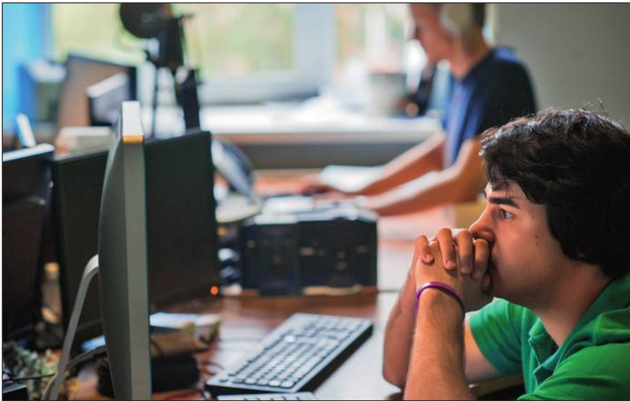
Постоянное присутствие вербовщиков ИГИЛ в соцсетях.

Активисты ИГИЛ поддерживают свои аккаунты в сетях Facebook, Twitter, Instagram, Friendica, Telegram. Активно они заявили о себе и в российских социальных сетях: «ВКонтакте» и «Одноклассниках».