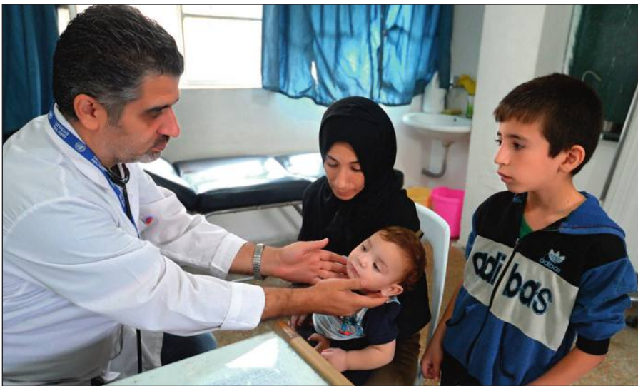
Истинный ислам призывает к состраданию и милосердию. Врач осматривает ребенка в медицинском пункте лагеря при одной из школ Дамаска.

Радикалы объявляют «врагами ислама» всех несогласных с ними мусульман. Ультрарадикальные группировки признают террор и насилие единственным способом достижения провозглашенных ими целей.